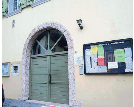
L'ambulatorio di Martignano di via Menghin è senza medici